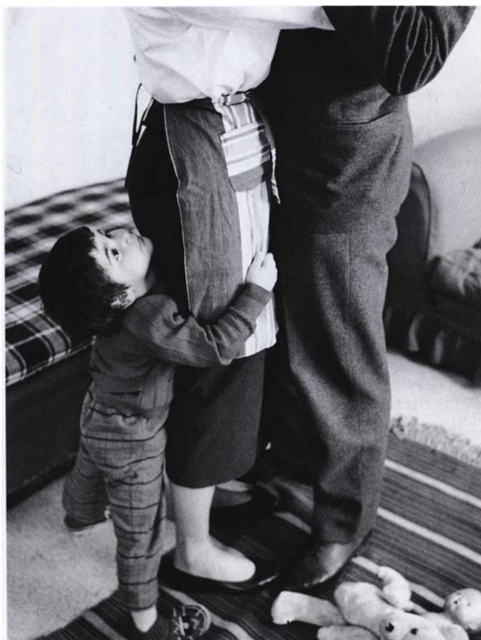
Roma, anni Cinquanta.